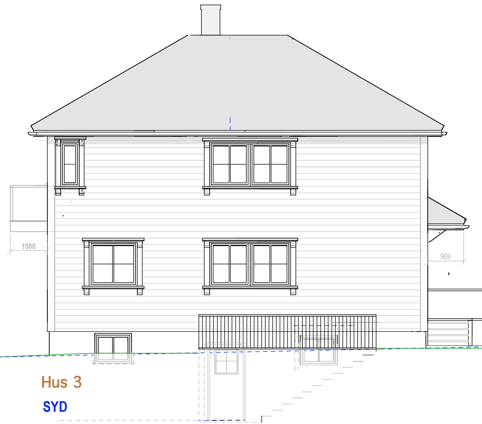
Hus 3 SYD