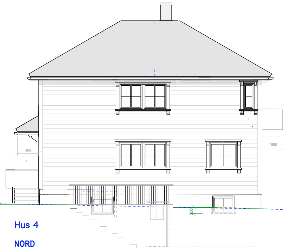
Hus 4 NORD